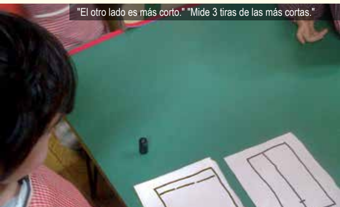
"El otro lado es más corto." "Mide 3 tiras de las más cortas."