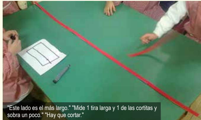
"Este lado es el más largo." "Mide 1 tira larga y 1 de las cortitas y sobra un poco." "Hay que cortar."

Días 5 y 6 – A cada equipo de trabajo se le entrega una colección de tiras de goma EVA con distintas longitudes (una cinta de 1 metro de largo, 2 de medio metro y 4 de cuarto metro).