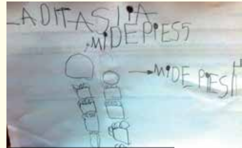
"La distancia mide pies 5. Mide pies 4."

precisión en los procedimientos de la actividad de medición, logra expresar la medida, resuelve y argumenta sus decisiones y conclusiones (vocabulario/terminología que utiliza). Si logra graficar/representar en el plano de la hoja, la actividad de medición realizada (por medio del dibujo y/o escritura): respetando distribución espacial, cantidad, dimensiones y disposición de los objetos utilizados, distancias de cada aro. Preguntas formuladas al niño: "¿cuál aro llegó más lejos?, ¿por qué?, ¿cuánto mide cada distancia (punto de lanzamiento de cada aro)?" . Todos verbalizan procedimientos realizados y elaboran conclusiones, tratando de utilizar un vocabulario relativo a la actividad de medición, ejemplo: "este aro llegó más lejos, en el otro es más corta la distancia", "medí la longitud", "hice una fila de tapitas para medir la distancia de cada aro y las conté de a dos... 2, 4, 6...; esta distancia mide 13 y la otra 14 tapitas", "la distancia mayor es en la que usé un palito más, 6 en uno y 5 para el otro". Un solo niño no logra realizar la propuesta (tuvo 7 días de inasistencias justificadas), sus compañeros le explican cómo resolver la propuesta.