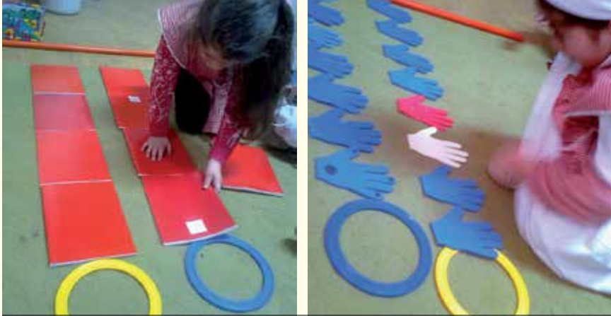
Evaluación de procesos de aprendizaje (Día 8). El desafío: resolver situación problema, argumentar, registrar.