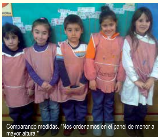
Comparando medidas. "Nos ordenamos en el panel de menor a mayor altura."

Día 7 – Se retoma una actividad realizada en marzo, en la cual cada niño midió su altura corporal y registró dicha medida en el cuaderno viajero. Se realiza un panel colectivo organizando la información. Reflexiones de los niños: "cada uno cortó la lana para que mida lo mismo que decía en el cuaderno", "la lana tiene la misma longitud", "la lana mide lo mismo que mi altura", "es larga como yo", "hay más bajos, medianos y más altos", "no se dice chiquitos porque somos todos de la misma edad, tenemos distintas medidas del cuerpo", "hay tres que medimos lo mismo", "dos somos de la misma altura".