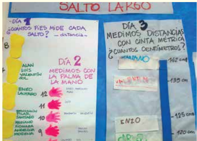
Juego de salto largo. Registro (Días 1, 2 y 3)

Día 1 – Se introduce la actividad a partir de la lectura de un texto informativo sobre los resultados de las pruebas de salto largo. Mediante el uso de la XO nos informamos acerca de los procedimientos que utilizan los jueces para medir las distancias de los saltos de cada deportista. Se genera la creación colectiva de la situación de juego: cómo podemos saber el resultado del juego, quién llegó más lejos, quién obtuvo una distancia mayor, si alcanza con estimar cada distancia para el registro en un papelógrafo, si podemos utilizar nuestro propio cuerpo para medir la distancia de cada salto. El grupo decide emplear la unidad de medida no convencional: pie. Se llega a un consenso de