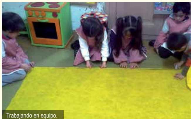
Trabajando en equipo.

"¿cuánto es ese poco?". Niños: "tiene que sobrar un poquito de cada lado". Trasladamos a la alfombra las medidas de la base de la mesa con las tiras utilizadas para analizar grupalmente. Un niño propone agregar una tira de las más cortas "para que nos sobre un poquito de cada lado", "yo sé, Maestra, cómo hacer, porque mi papá me enseñó a medir con la cinta métrica". Utilizando la cinta métrica, los niños miden y comparan longitudes. Registran la medida obtenida. El grupo intercambia opiniones: "después del 99 dice 1 m, no dice cien", "el 1 m quiere decir cien". Maestra: "¿100 qué?".