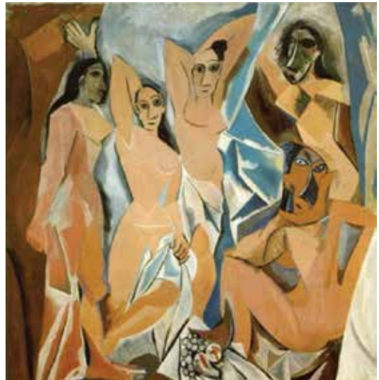
Las señoritas de Avignon, Las señoritas de Aviñón o de Avinyó es un cuadro del pintor español Pablo Picasso (España, 1881-1973), pintado en 1907. Está hecho mediante la técnica del óleo sobre lienzo y sus medidas son 243,9 x 233,7 cm.