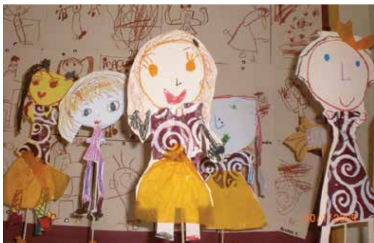
FOTOS 5, 6, 7 y 8 - Niños y niñas dibujándose a sí mismos.