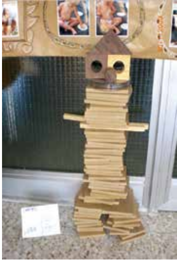
FOTO 3 - "Enrique Luna". Escultura en madera realizada por los niños de la Escuela Infantil.

La verdad es que los cuerpos abundaron. Hubo otra serie en la que cada cual se representó a sí mismo con plastilina blanca y botones, otra con un palillo, en el que se sujetaban los cuerpos decoradísimos con telas y papeles, y que se plantaban metiendo el palito en una bola de plastilina. Y otra más que eran las cabezas de cada niño, moldeadas en arcilla, todas ellas muy bonitas.