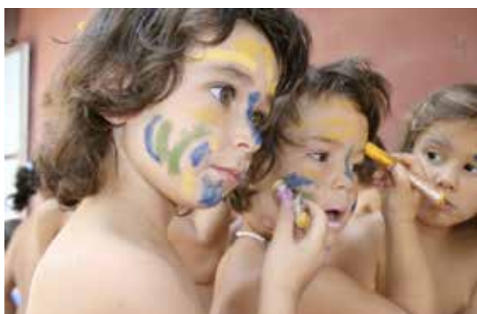
FOTO 1 - Jugar, pintarse, transformarse...

El proyecto discurrió bien desde el inicio. Decoramos la entrada, hicimos una “circular artística” 2 , expusimos unas fotos preciosas de los niños pintándose el cuerpo, que habíamos hecho en el verano, y añadimos unos poemas alusivos al tema: “cuerpo”.