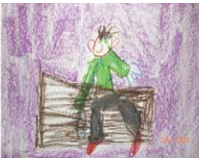
FOTO 4 Dibujo con modelo.