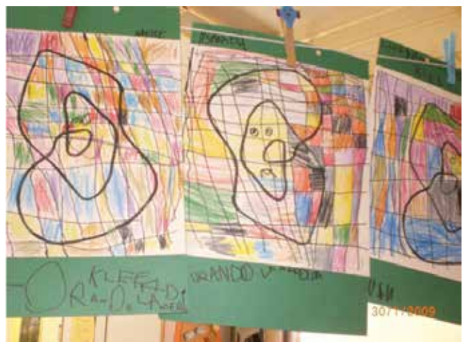
FOTO 2 - Inspirándonos en Paul Klee.