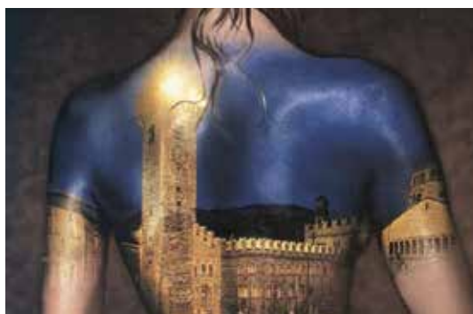
Performance de Rolando Peña. Artista contemporáneo venezolano.

El arte corporal o “Body Art” es un estilo enmarcado en el arte conceptual, de gran relevancia en los años 1960 en Europa y, en especial, en Estados Unidos. Se trabaja con el cuerpo como material plástico, se pinta, se calca, se ensucia, se cubre, se retuerce... el cuerpo es el lienzo o el molde del trabajo artístico. Suele realizarse a modo de acción o performance , con una documentación fotográfica o videográfica posterior.