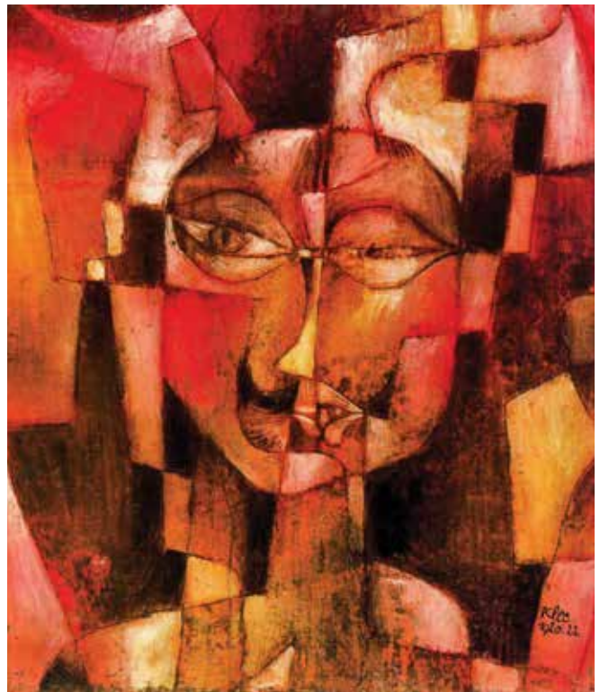
KLEE, Paul (Suiza, 1879-1940) · Cabeza con bigote alemán (1920). Óleo y pluma sobre papel, pegado sobre madera. 32,5 x 28,5 cm.

quedamos satisfechos y con la sensación de comprender los motivos de los artistas al elegir el cuerpo como tema para sus obras.