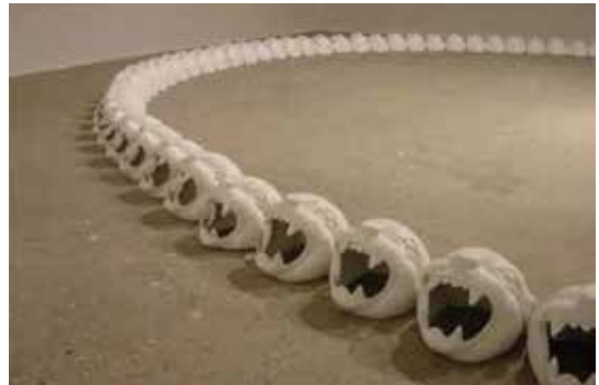
Instalación "Para llamar a las fuerzas". Círculo mágico de 5 metros de diámetro con cabezas de jaguar blanco, que busca transportar al espectador a un ambiente mágico, onírico, en el que pueda reflexionar sobre sí mismo y las fuerzas existentes en su entorno.

Me gustó que explicara que todo lo que ella hacía, provenía de su adentro. O de cosas de fuera, que ella hacía propias: "Mis obras contienen las historias que me cuentan, los sueños que tengo, lo que vivo, y las ideas de los niños con los que me tropiezo".