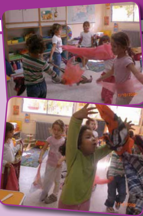
FOTOS 9 y 10 - "Echar cuerpo es crecer, es volar, es ensancharse".