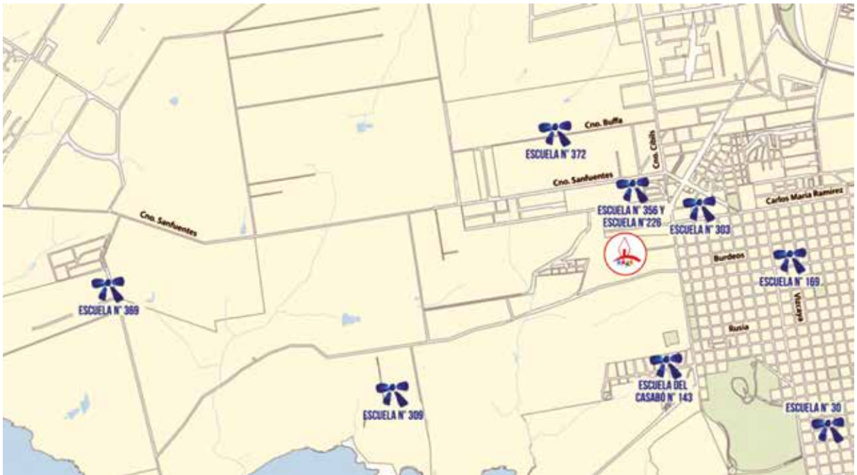
Mapa de la zona de influencia del Club de Niños

En el segundo trimestre del año escolar se focalizó la experiencia en un total de siete escuelas que pertenecen a los barrios Cerro, Casabó, Punta Yeguas y Santa Catalina. Con la utilización de la entrevista como estrategia se trabajó con las maestras de los niños y niñas que, desde el Club de Niños, se habían identificado como que podrían presentar mayores barreras para el aprendizaje y la participación, buscando conocer la visión de las maestras sobre ellos y poder acompañar de mejor manera su aprendizaje en la escuela. En esta instancia de trabajo se acordaron líneas de acción para los dos espacios, el escolar y el extraescolar, que pudieran contribuir a fortalecer el proceso de aprendizaje de los niños y niñas. Se establecieron relaciones entre aquellas fortalezas o potencialidades –identificadas por los maestros– a las que el Club de Niños, por ser una estructura más flexible, podía brindar los tiempos y espacios para su enriquecimiento, y las debilidades –identificadas por los mismos docentes– que pudieran ser abordadas desde un espacio psicopedagógico específico, pero también desde el trabajo en el aula común, atendiendo a la necesaria reestructuración de ese espacio para enseñar a la diversidad de los estudiantes. Una forma de hacer frente a esta exigencia, que el trabajo en clave de articulación y complementariedad intentó profundizar, es el Diseño Universal de Aprendizaje (DUA).