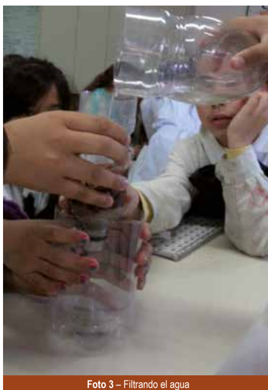
Foto 3 – Filtrando el agua

Hacemos pasar el agua por el filtro, cuidando de no trasvasar lo decantado (Foto 3).