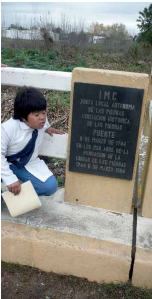
Placa en cabecera del puente sobre el Paso

Como se puede observar, se establece una contradicción entre la fecha del pie de imagen de plano antiguo de la ciudad de Las Piedras y la que aparece en la placa sobre el puente. Pero también observamos que la de la placa coincide con la fecha de venta de tierras aparecida en el folio donde la viuda de Mascareñas vende las tierras al Pbro. Castilla.