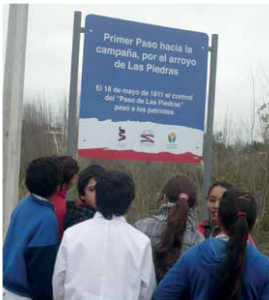
Salida didáctica a Paso de Calpino

VI - Salida didáctica. Al Paso de Calpino, antiguo Paso de Las Piedras (hipótesis 4c) - ya casi en el lugar, un cartel nos confirmaba que ese era el sitio por donde pasaron los primeros pobladores; y otro decía que por allí pasó el Éxodo, por lo que dedujimos que también pasaron Posadas y su ejército, y Artigas hacia el Primer Sitio. O sea que fue la primera salida de Montevideo hacia la campaña oriental.