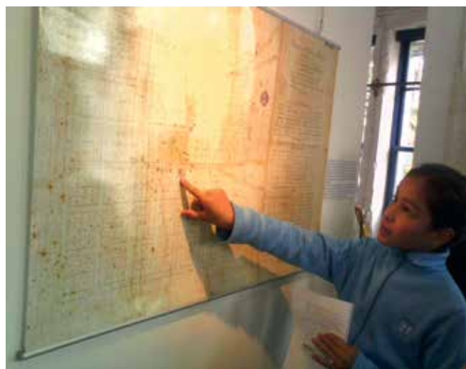
Exposición “Historia medida de un rico patrimonio”

IV - Salida didáctica. Exposición de planos “Historia medida de un rico patrimonio” (exposición de los primeros planos, y planos antiguos de ciudades del interior del país con motivo de los festejos del Bicentenario). Si bien el plano de nuestra ciudad databa de 1838, la fuente en este caso fue el pie de imagen que decía: “Las Piedras. Establecida en 1795, ya tenía pobladores dos décadas antes, una veintena de familias agricultoras canarias, asturianas y gallegas” . Aparece entonces como fecha de establecimiento del primer poblado el año 1795.