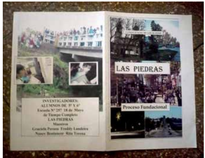
Tapa y contratapa del folleto

XV - Comunicación. Presentación de la investigación en PowerPoint a padres y a todo el colectivo docente de la escuela. Elaboración de un folleto, que recopiló los datos significativos, fotografías, documentos de interés. Cada alumno tuvo el suyo y se enviaron a distintas instituciones educativas, culturales y gubernamentales del departamento.