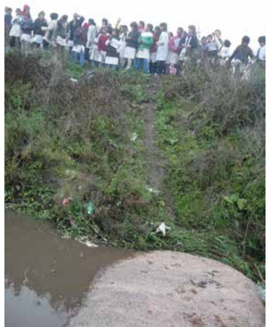
Las piedras que dieron nombre al Paso y a nuestra ciudad