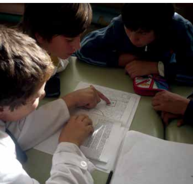
Localización del primer centro poblado en plano actual