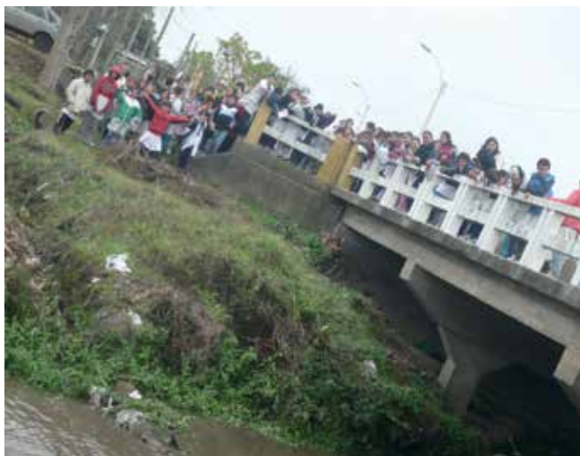
Salida didáctica a Paso de Calpino, antiguo Paso de Las Piedras