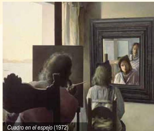
Cuadro en el espejo (1972)

Mediante el uso del blog se les propuso que investigaran la obra de Salvador Dalí y su estilo, para hacer luego una puesta en común.