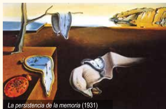
La persistencia de la memoria (1931)